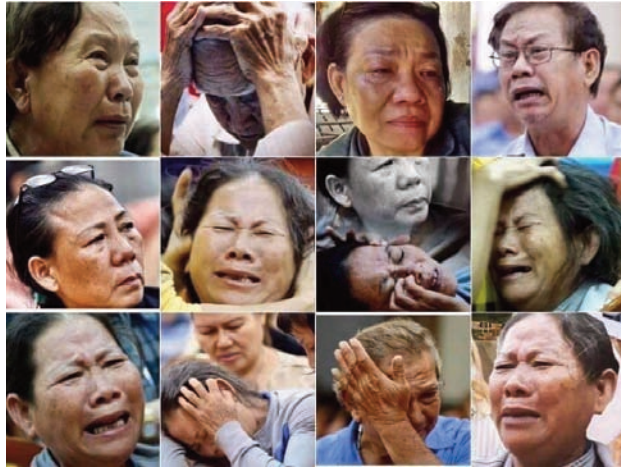
Dân oan Thủ Thiêm

có khoảng 160 hộ dân cư nằm ngoài khu vực đã được qui hoạch, nhưng chánh quyền Thành phố HCM vẽ lại bản đồ, và thu hồi đất này. Chánh quyền không định cư đầy đủ cho người dân bị cưỡng chế, đề cuộc sống của họ rất thảm thương trong thời gian dài. Dùng bạo lực thu hồi đất là vi phạm quyền sở hữu tư và xử dụng sai trái nguyên tắc công quyền. Chánh quyền làm sai nguyên tắc là trưng thu đất tư là chỉ cho công ích. Trong đại dự án này có nhiều khu vực không nhằm cho công ích mà giao cho tư doanh xây nhà cao ốc, hay chánh quyền thực hiện dự án không cần thiết là Nhà Hát Giao Hưởng..