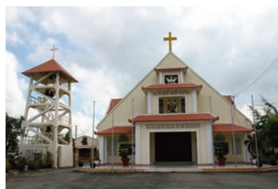
Nhà thờ Thủ Thiêm có nguy cơ bị giải tỏa

– Ngày 19/05/2018, Một tuyên bố được đăng tải trên mạng với chữ ký của hơn 10 tổ chức dân sự và hơn 100 cá nhân kêu gọi chính quyền trả lại chùa Liên Trì và các cơ sở của Dòng Mên Thánh Giá ở Thủ Thiêm tại Quận 2, Thành phố Hồ Chí Minh. Chùa Liên Trì có tuổi đời hơn 100 năm đã bị phá hủy. Nhà thờ Thủ Thiêm và Tu viện Dòng Mên Thánh Giá cũng có tuổi đời hơn 100 năm hiện cũng có nguy cơ bị Nhà cầm quyền giải tỏa. Tuyên bố cũng tố cáo việc cưỡng chế đất không chỉ xảy ra ở Thủ Thiêm mà còn diễn ra ở nhiều nơi khác trên toàn quốc. [27]