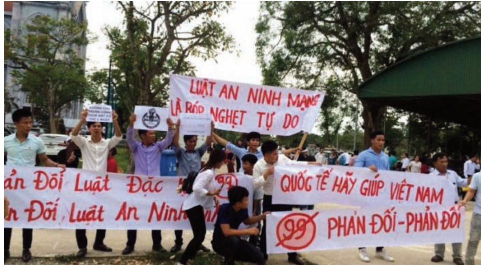
Biểu tình chống Luật An Ninh Mạng và Dự Luật Đặc Khu tại Hà Tĩnh