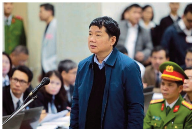
Đinh La Thăng

Vụ Mobilphone. Là vụ đại tham nhũng do cấu kết giữa viên chức rất cao cấp của chính quyền VN và tư bản đồ. Công ty điện thoại di động của nhà nước Mobilphone mua công ty AVG của tư nhân (2016) với giá 8,889 tỷ đồng ($391 triệu). Ngay việc công ty tư nhân đi bán cho quốc doanh là đi ngược chính sách cổ phần hóa. Nhưng do sự cấu kết của viên chức cao cấp của Bộ Thông tin,