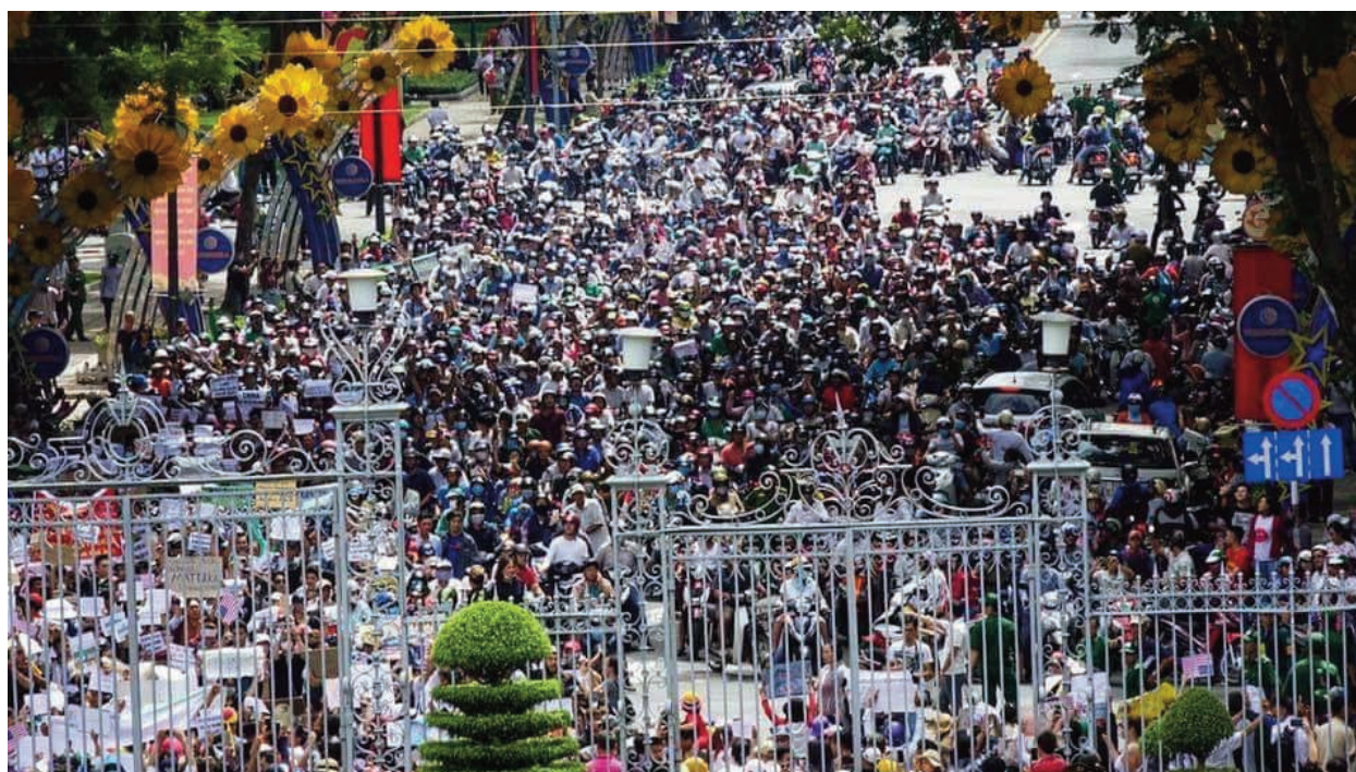
Biểu tình tại thành phố Hồ Chí Minh ngày 10 tháng 6 năm 2018 để chống Luật An Ninh Mạng và Dự Luật Đặc Khu Kinh Tế