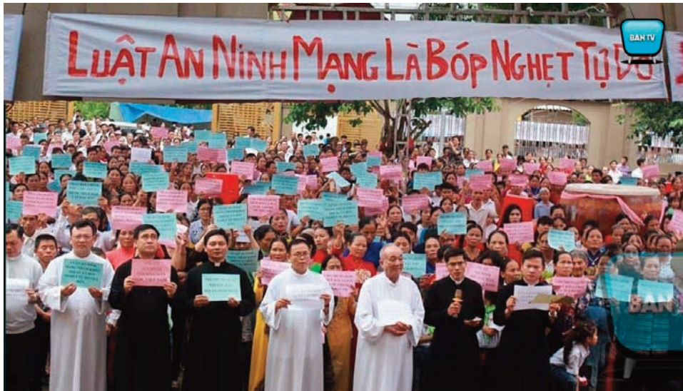
Biểu tình tại Giáo Phận Vinh 10-6- 2018