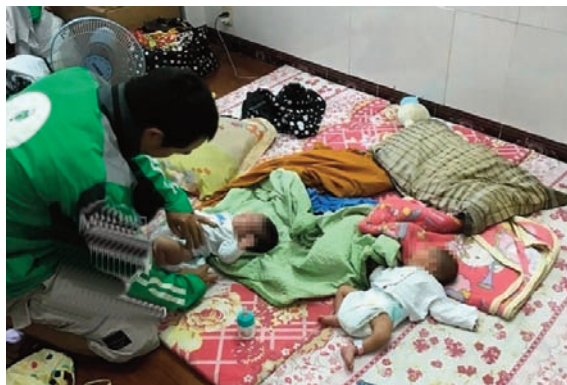
Hai bé sơ sinh được giải cứu trước khi bị mang bán sang Trung Quốc

Bộ Công An cho biết trong từ năm 2012 đến 2017 đã điều tra 1.021 vụ buôn người, bắt giữ 2.035