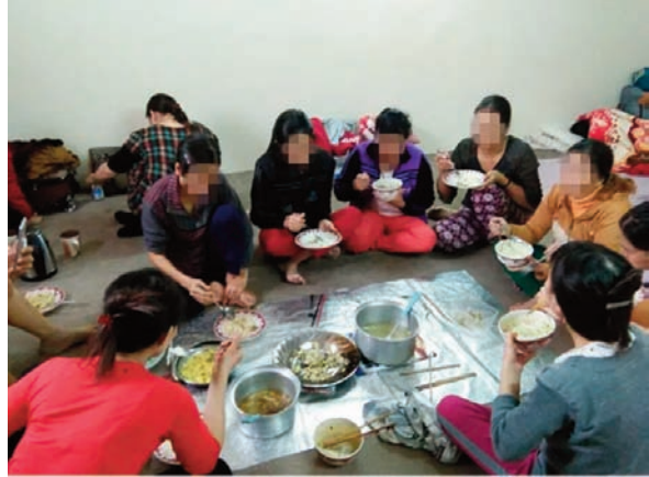
Lao động nữ tại Trung Đông thường bị đói xử rất tàn tệ

là còn cao hơn cả tiền bán lúa hai vụ nữa. Tôi thậm chí còn không có miếng băng vệ sinh và bị ép phải rửa chân và massage cho họ. Đôi khi bà chủ sẽ vớt đồ ăn thừa đi chứ không để tôi được ăn nó. Linh kể, bản thân chị đã gặp một số phụ nữ Việt Nam khác ở Ả Rập Saudi. Người trẻ nhất trong số họ là 28 tuổi, còn người lớn tuổi nhất đã 47. Họ chủ yếu là nông dân đến từ những vùng thôn Việt Nam, nhiều người còn là người dân tộc thiểu số. Ngay sau khi tôi đặt chân đến sân bay ở Riyadh, họ (nhân viên công ty Saudi cung cấp dịch vụ thuê người giúp việc) đẩy tôi vào một căn phòng lớn với hơn một trăm người khác. Khi gia đình chủ đến đón tôi, ông ta đã lấy hộ chiếu và hợp đồng lao động của tôi. Hầu hết phụ nữ tôi nói chuyện cùng đều bị tương tự như vậy. Philippines đã phải ra lệnh cấm xuất khẩu lao động sang thị trường Trung Đông. Việt Nam cần cân nhắc đưa ra lệnh cấm tương tự.[10]