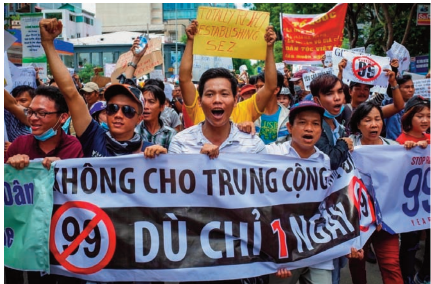
Hàng chục ngàn người dân biểu tình ở Sài Gòn hôm 10 Tháng Sáu, 2018 chống cả dự luật “Đặc Khu Kinh Tế” và dự luật “An Ninh Mạng.”