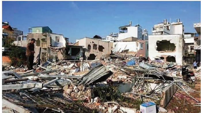
Người dân tại Vườn Rau Lộc Hưng tìm về căn nhà của mình đã bị nhà cầm quyền đập nát trong một đêm để có tìm những gì còn sót lại

khoảng 200 gia đình dân Lộc Hưng, quận Tân Bình. Đây là vụ điển hình của sự lấy quyền sống của dân, thể hiện tính hung bạo của cường quyền CS, người dân không được lấy ý kiến, không được thông báo trước khi thi hành lệnh cưỡng chế. Dân chúng phản đối mãnh liệt. Đa số người định cư ở đây có từ hơn 60 năm từ Bắc di cư vào Nam, những gia đình nghèo, sống bằng nghề trồng rau. Nhu cầu công vụ để thu hồi đất của những người dân không thích hợp cho xây dựng công ích không quan trọng và không khẩn thiết. Xây một trường học có thể tìm một nơi khác không khó khăn. Cho nên chỉ xét sơ qua về nhu cầu và về cách cưỡng chế tàn nhẫn, không tuân thủ luật lệ của chánh quyền, làm cho nhiều người nghĩ tới đằng sau vụ này có tư bản đồ, như hàng ngàn vụ lấy đất dân đã xảy ra.